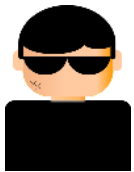
攻撃者 (A社のなりすまし)